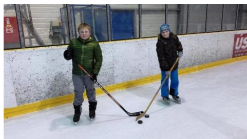
Bruslení v Boskovicích