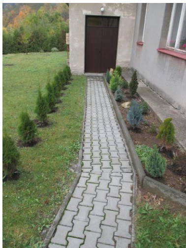
Školní záhonek a zeleň v zadní části budovy školy