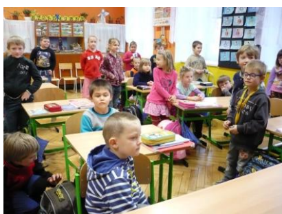
Předškoláci z mateřských školek na návštěvě ve škole