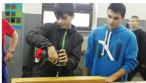
Technohrátky ISŠ Moravská Třebová a SOŠ a SOU Polička