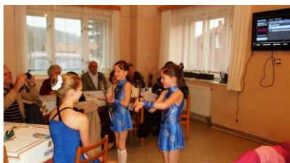
Vystoupení žáků v Chrastavci na Hudárně