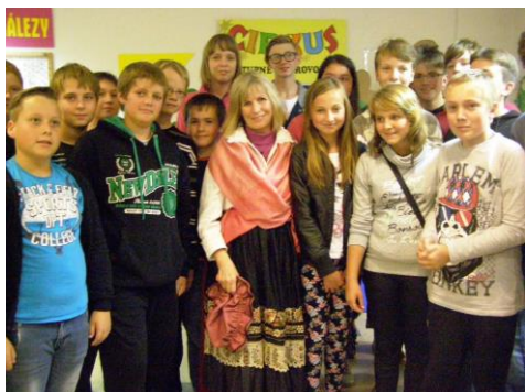
Návštěva Prahy a České televize