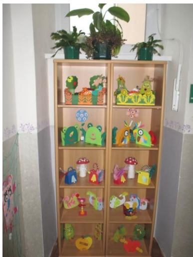
Vitrina na výrobky školní družiny