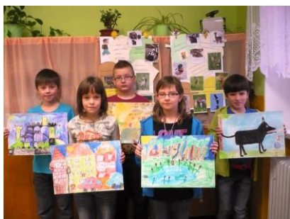
Malování pro Konto Bariéry