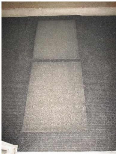
Položení zátěžového koberce a rohoží na vstupu do ZŠ 28