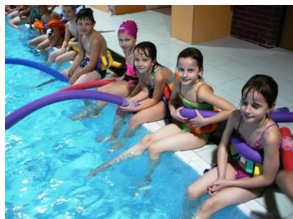
Plavání žáků 3. a 4. třídy na plaveckém bazénu ve Svitavách