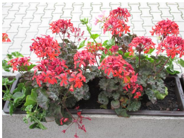
Rozkvetlé zádvěří u vchodu školy