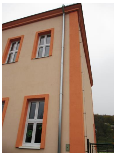
Nové svody a okapy