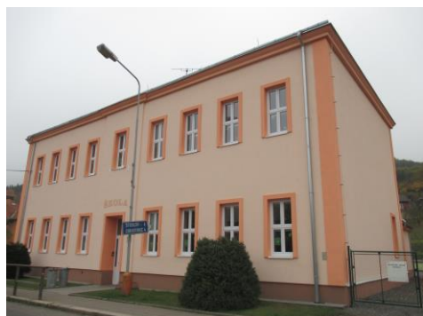
Zateplení pláště budovy skelnou vatou a nové omítky