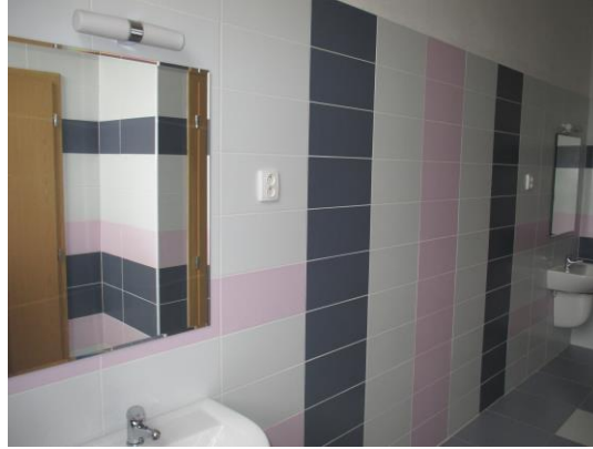
Nové obklady, toalety, zrcadla, osvětlení, topení, dveře a zárubně