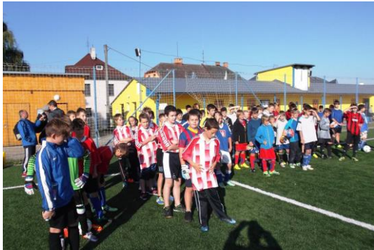
Obvodní kolo v minikopané ve Svitavách - 6. – 9. třída