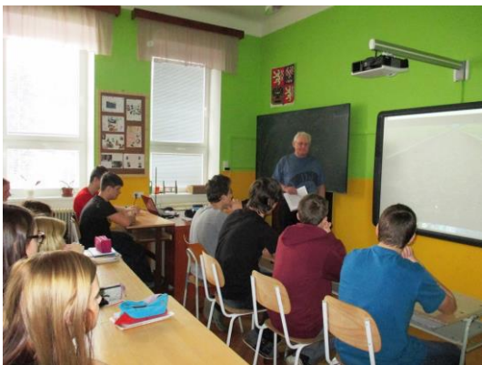
Beseda k výročí osvobození Osvětimi