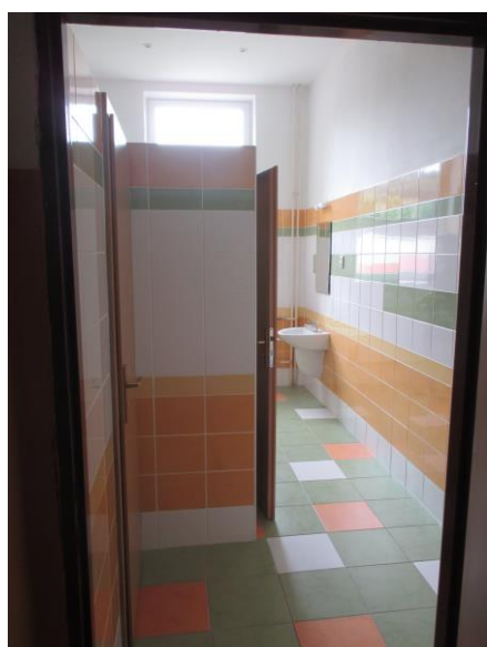
Nová dlažba, nové osvětlení, umyvadla, zárubně