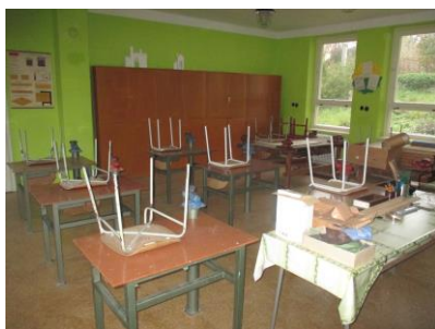
Dílny - nová podlaha Nátěry skříněk na náradí Vymalování prostor