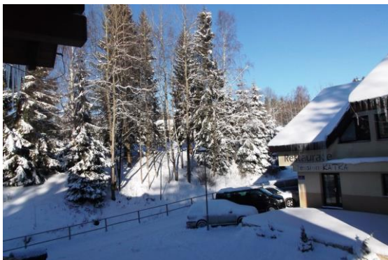
Lyžařský kurz v Harrachově se Základní školou Březová nad Svitavou