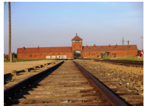
Exkurze do Osvětimi