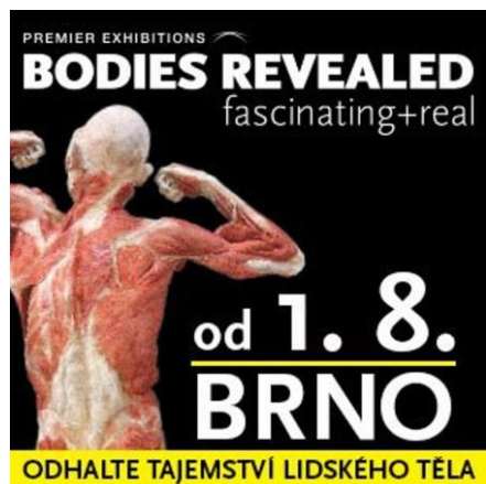
Výstava Odhalené lidské tělo – žáci 7., 8., 9. ročníku