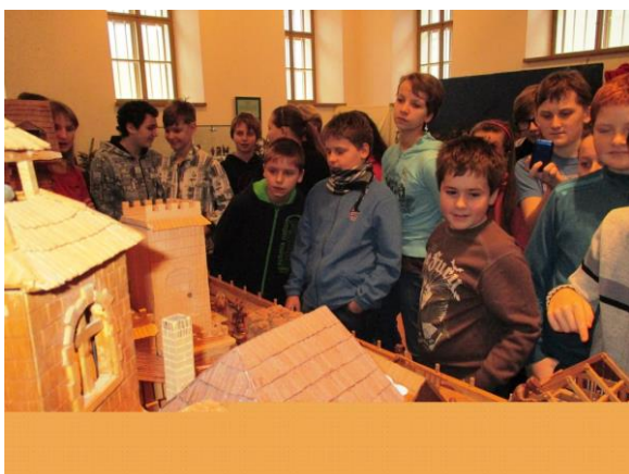
Vánoční výstava v Poličce