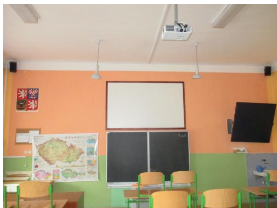
Vybavení tříd dataprojektory a audiotechnikou a promítací plochou