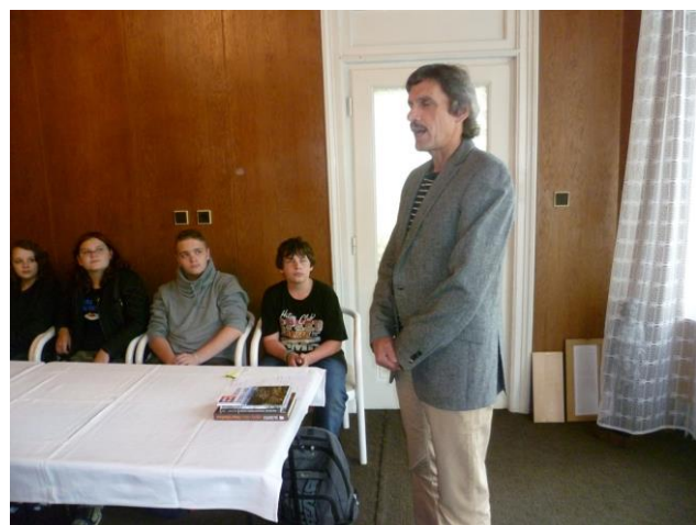
Práce na radnici – historie, současnost