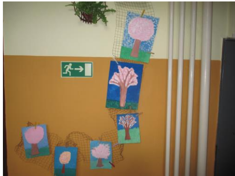
Nátěr soklu a vymalování části chodby v přízemí