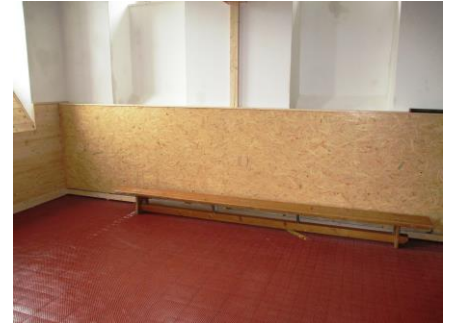
Dřevěné obložení tělocvičny, vymalování a zhotovení krytů radiátorů