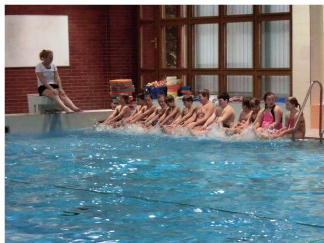
Plavecký výcvik žáků 3. a 4. ročníku 10 lekcí po 2 hodinách