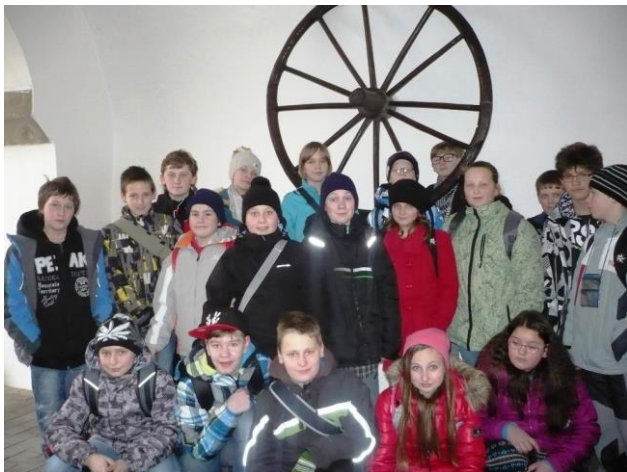
Návštěva brněnské hvězdárny