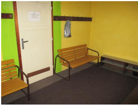
Obložení zárubní dveří, vymalování šatny dílen a vybavení zátěžovým kobercem