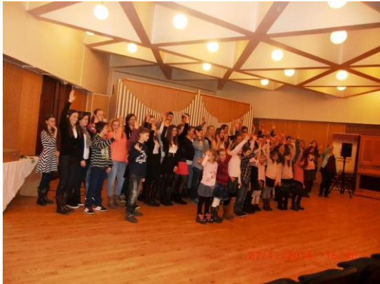
Vojtovo Hudební město – výtvarná akce Pardubické střípky