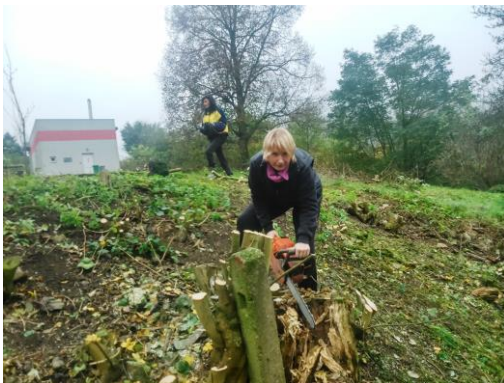
Úprava prostorů v okolí školy, vykácení a úklid náletových dřevin