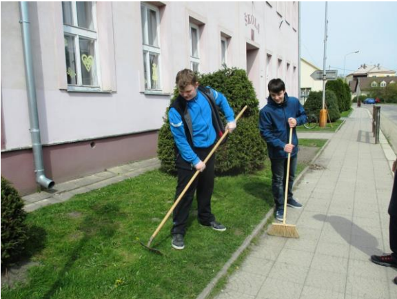
Úklid okolí školy