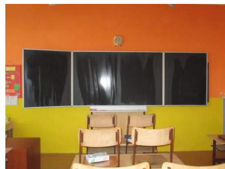
Vymalování třídy pro žáky 6. ročníku včetně instalace nové tabule